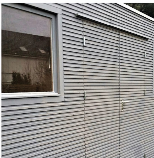
Gleichmäßige Patina von Anfang an mit Vergrauungsanstrich