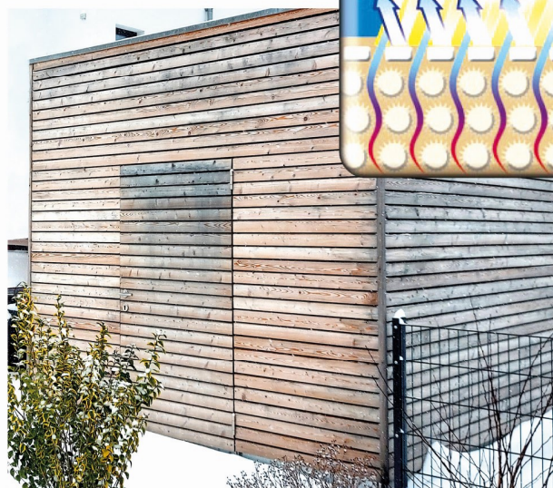
Unregelmäßige Nachdunklung ohne Vergrauungsanstrich